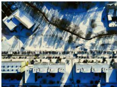
Ulice Radostelák je místem častých problémů s parkováním. Vše k zmapování na straně 2