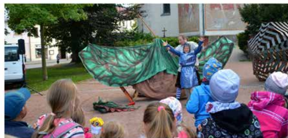
Stavovčanskými slavnostmi započal novoměstský podzim.

ročník XXXI. | číslo 11 | 1. listopadu 2021